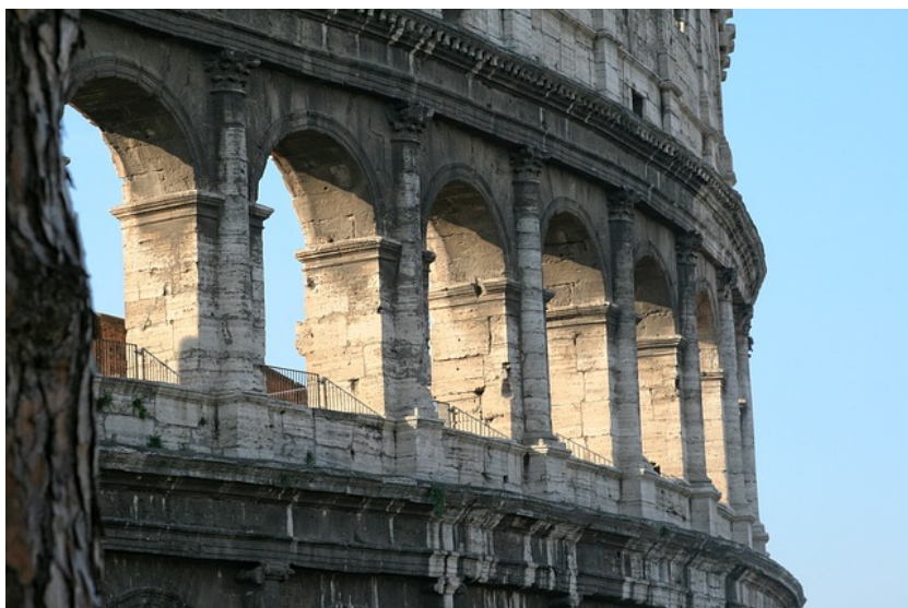
Roma – Colosseo

dell'OS 5.1. allocata su Roma Capitale (50%) è ben inferiore alla quota di popolazione di Roma Capitale sul totale della popolazione potenzialmente interessata dalle ST.