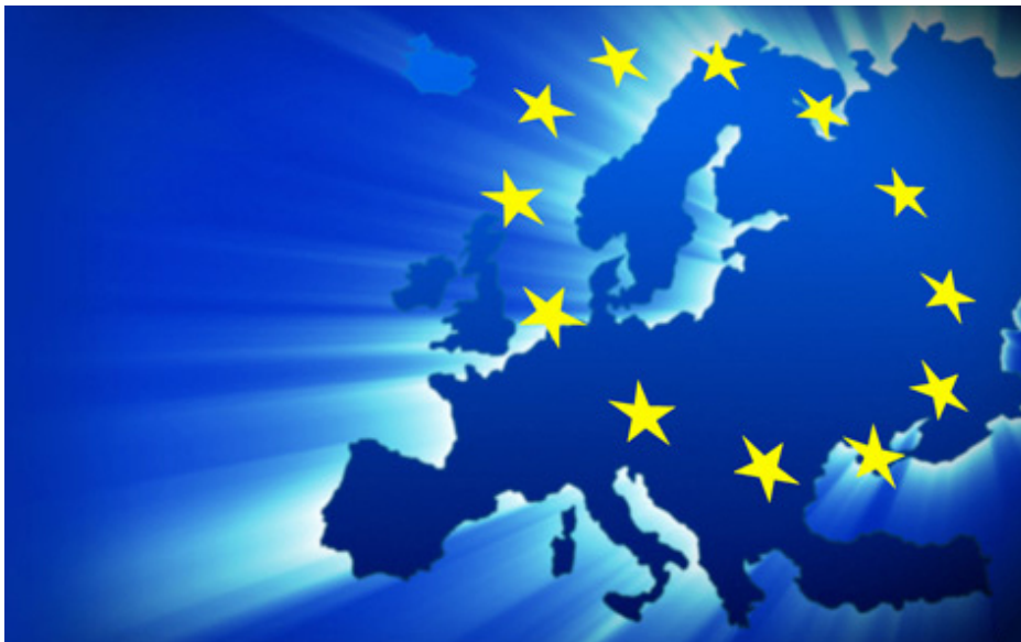
Europa – Immagine ex Pixabay

[1] Il MEF – RGS ha rilasciato, a partire dall'autunno del 2021 diverse Circolari volte a spiegare dettagliatamente procedure di gestione e di attuazione e rendicontazione degli interventi del PNRR. Oltre a quella del 14 Ottobre 2021 sulla selezione dei progetti, altre due Circolari particolarmente significative sono le seguenti: