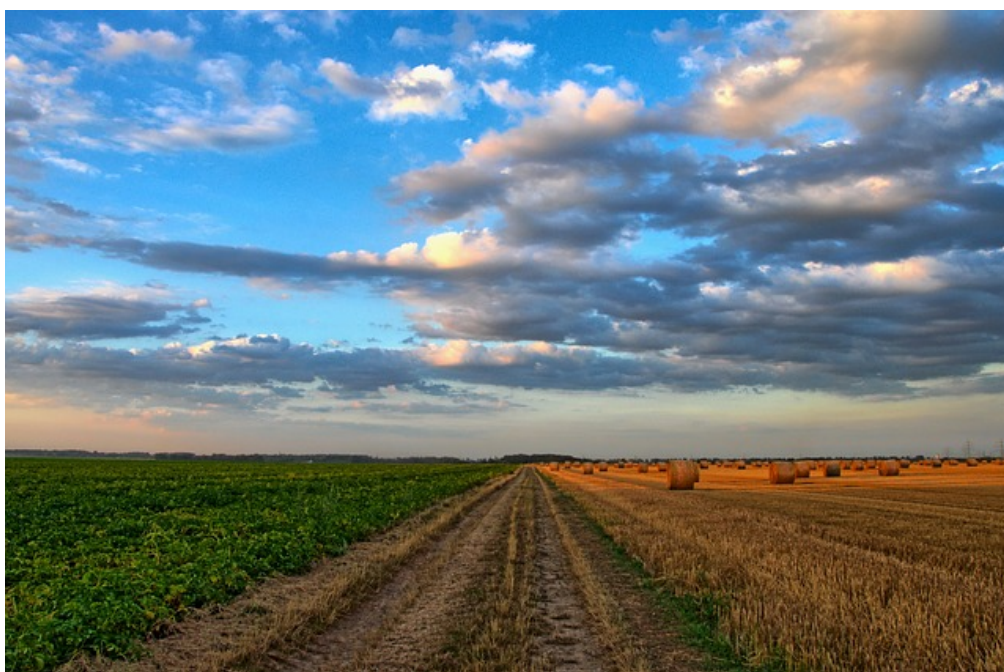
Immagine ex Pixabay

Tradizionalmente i servizi di cura alla persona e alla comunità nei Paesi dell'Europa continentale sono finanziati dal Settore Pubblico (tramite la fiscalità generale), anche se questo non necessariamente implica parimenti l'erogazione diretta da parte dell'operatore pubblico, in quanto la fornitura dei servizi di welfare, sovente, viene esternalizzata ad operatori privati (commerciali e non profit).