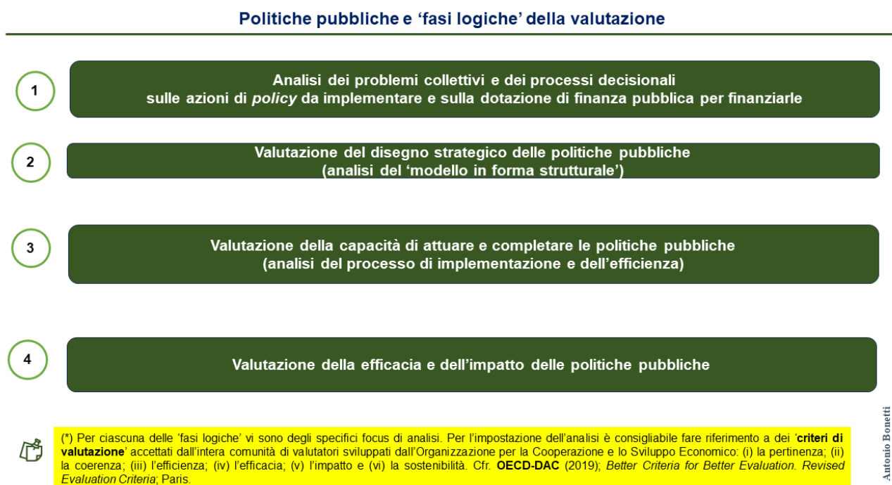
Figura 1 – Le fasi logiche della valutazione delle azioni di policy

3. Se si considerano le domande di valutazione a cui rispondono le analisi di efficienza, di efficacia e di impatto, sarebbe più corretto associare analisi di efficacia e